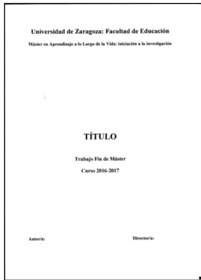
Portada (página 3 sin numerar)