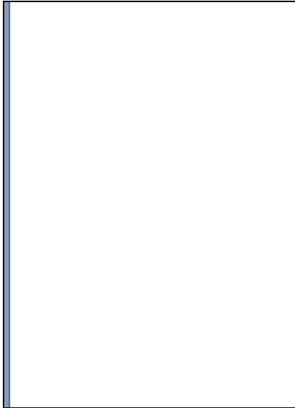
Página de cortesía (página 1 sin numerar)