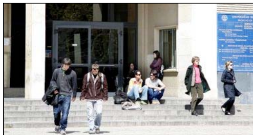
Los estudiantes de la Universidad de Zaragoza tendrán más dificultades para salir a estudiar fuera.

Esto obligará, según figura en el informe que acompaña a las cuentas regionales, "a realizar un esfuerzo en ejercicios posteriores, al haber comprometido un gasto plurianual que habrá que reprogramar, delatando el mismo un año más, con el objetivo de mantener el gasto total hasta el final del periodo". En el mismo documento se reconoce que este tipo de asignación, "destinada a la mejora de la calidad de la docencia, la investigación y la gestión, se precipita". Y eso a pesar de reconocer que "desde el punto de vista de los modelos económicos de enseñanza universitaria, las recomendaciones de los expertos pasan por incrementar esta vía de